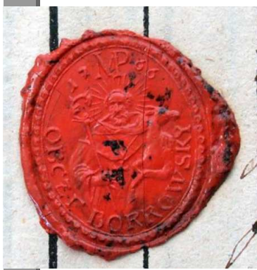
Pečeť obce Dolní Bory z roku 1766

Na základě zmíněných poznatků je možno pokusit se shrnout počátky a následný vývoj obou borských kostelů a jejich vzájemnou chronologickou návaznost. Přestože dosavadní literatura je klade přibližně do stejného období, nové poznatky tuto shodu jednoznačně vylučují. Je pravděpodobné, že produktem shodné doby jsou kostel sv. Martina v Horních Borech, zřízený zřejmě teprve brněnskými johanity po polovině 13. století, a to v plném rozsahu své středověké části, a velký presbytář u sv. Jiljí. Naproti tomu loď dolnoborské svatyně je výrazně starší a představovala buď prvotní sakrální stavbu původního sídliště před jeho rozdělením na dvě majetkově odlišné poloviny, nebo ještě spíše vlastnický kostelík, příslušející k blízkému dvorci, pozdější zákupní rychtč čp. 9. Tento dvorec představoval nejspíše prvotní jádro zdejšího osídlení a vyvíjel se alespoň v období středověku odděleně od zbylé části vsi, neboť po něm nenacházíme v dostupných středověkých pramenech žádné konkrétní zmínky. Jeho původní význam však již v rámci vrcholně středověké kolonizace