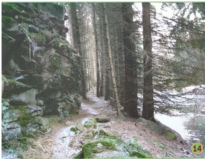
14. Skály v údolí řeky Oslavy nedaleko bývalé krásněveské pily- trojmezí Dolní Bory – Krásněves - Zahradiště

Mapový podklad, ortofoto (č. 530823/2) a Indikační skica (č.j.11718/2013) zakoupeno od ČUZK - léto 2020