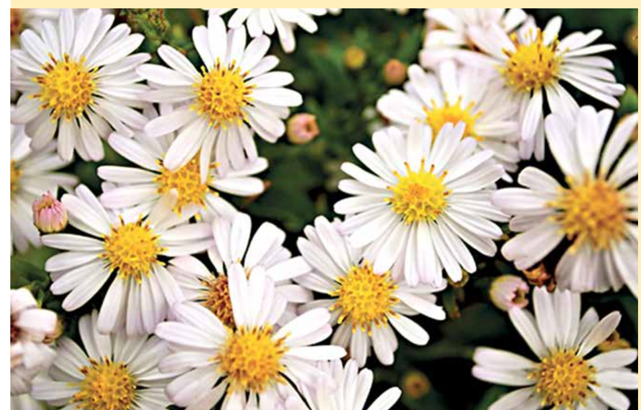
> Hvězdnice keříčková

Cílem výsadby bylo upravit stávající zeleň a do volného prostoru umístit stromy, keře, trvalky a rostliny, aby byla odcloněna obytná a relaxační část parku od zemědělského areálu, umožněn sběr ovoce k přímé konzumaci, vytvořena zákoutí pro aktivní a pasivní odpočinek návštěvníka a příznivé prostředí pro ptáky, drobné živočichy a hmyz.