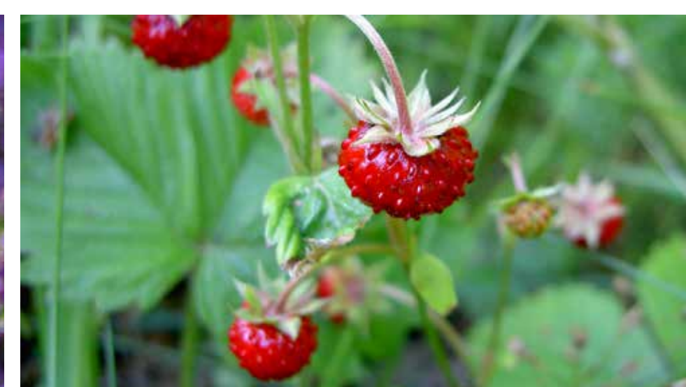
> Jahodník obecný