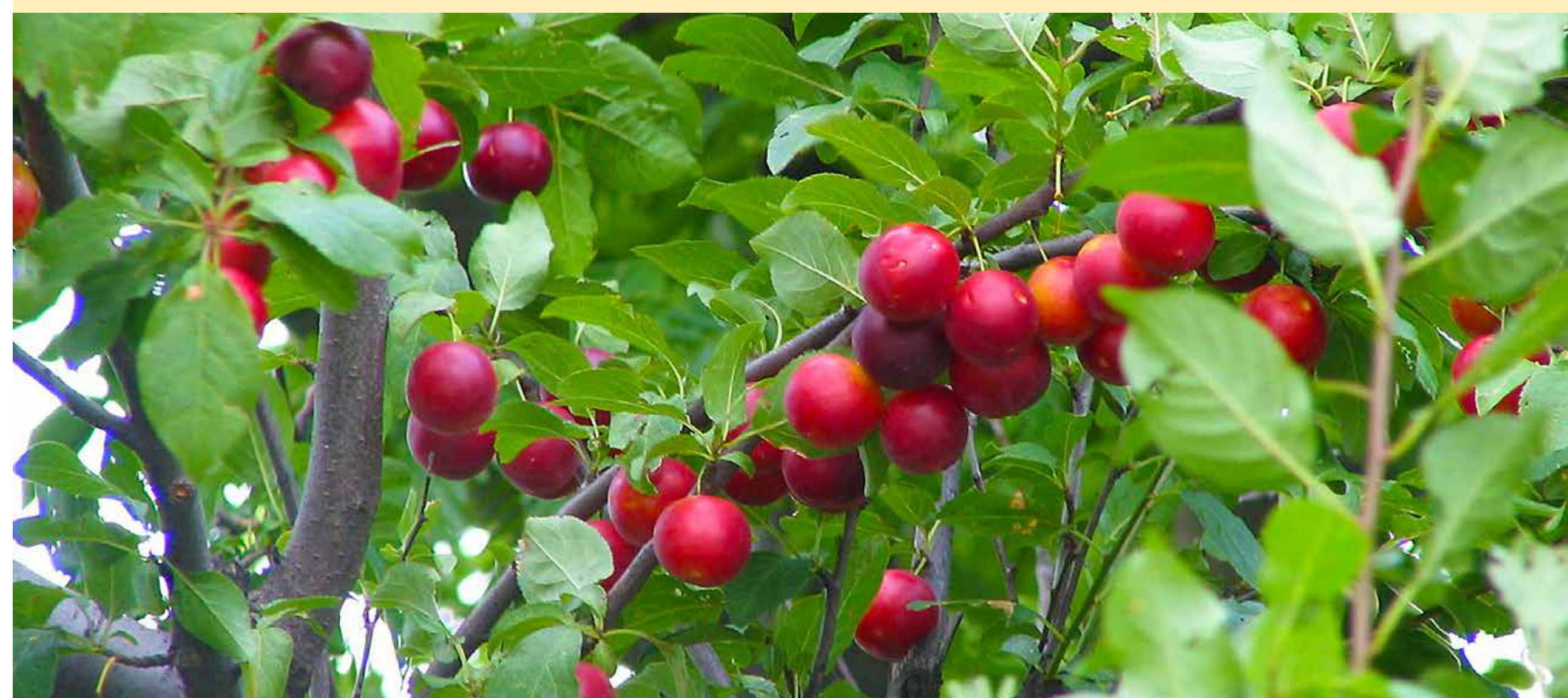
> Myrobalán třešňový

Za hlavní jehličnaté stromy byly zvoleny jedle korejská a nordmanská, jedlovec kanadský, smrk ztepilý a jeho kultivary a borovice kleč. Z listnatých stromů lípa srdčitá, hloh obecný, dub červený a habr obecný. Z ovocných odrůd byly vysazeny červeno a žlutoplodé odrůdy jahodníku, kamčatské borůvky, zimolez kamčatský, muhovník, temnoplodec a myrobalán, který kromě plodů park obohatí červeným zbarvením. Travnatý podrost tvoří kombinace stálezelených ostřic, které pestrými barvami doplňují květy trvalek.