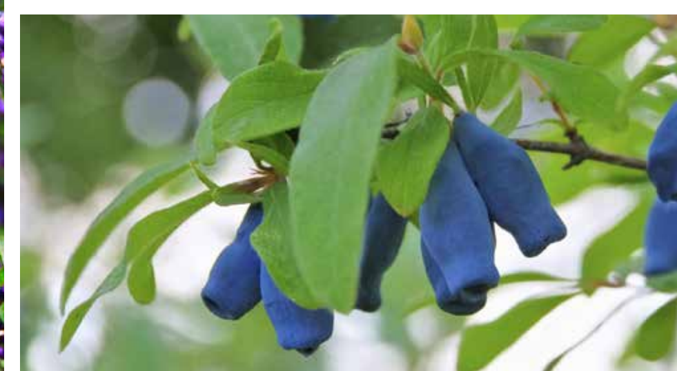
> Zimolez kamčatský