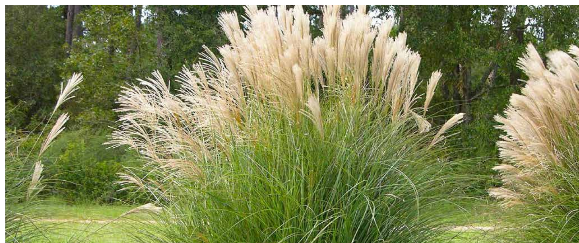
> Miscantus čínský

Za hlavní jehličnaté stromy byly zvoleny jedle korejská a nordmanská, jedlovec kanadský, smrk ztepilý a jeho kultivary a borovice kleč. Z listnatých stromů lípa srdčitá, hloh obecný, dub červený a habr obecný. Z ovocných odrůd byly vysazeny červeno a žlutoplodé odrůdy jahodníku, kamčatské borůvky, zimolez kamčatský, muhovník, temnoplodec a myrobalán, který kromě plodů park obohatí červeným zbarvením. Travnatý podrost tvoří kombinace stálezelených ostřic, které pestrými barvami doplňují květy trvalek.