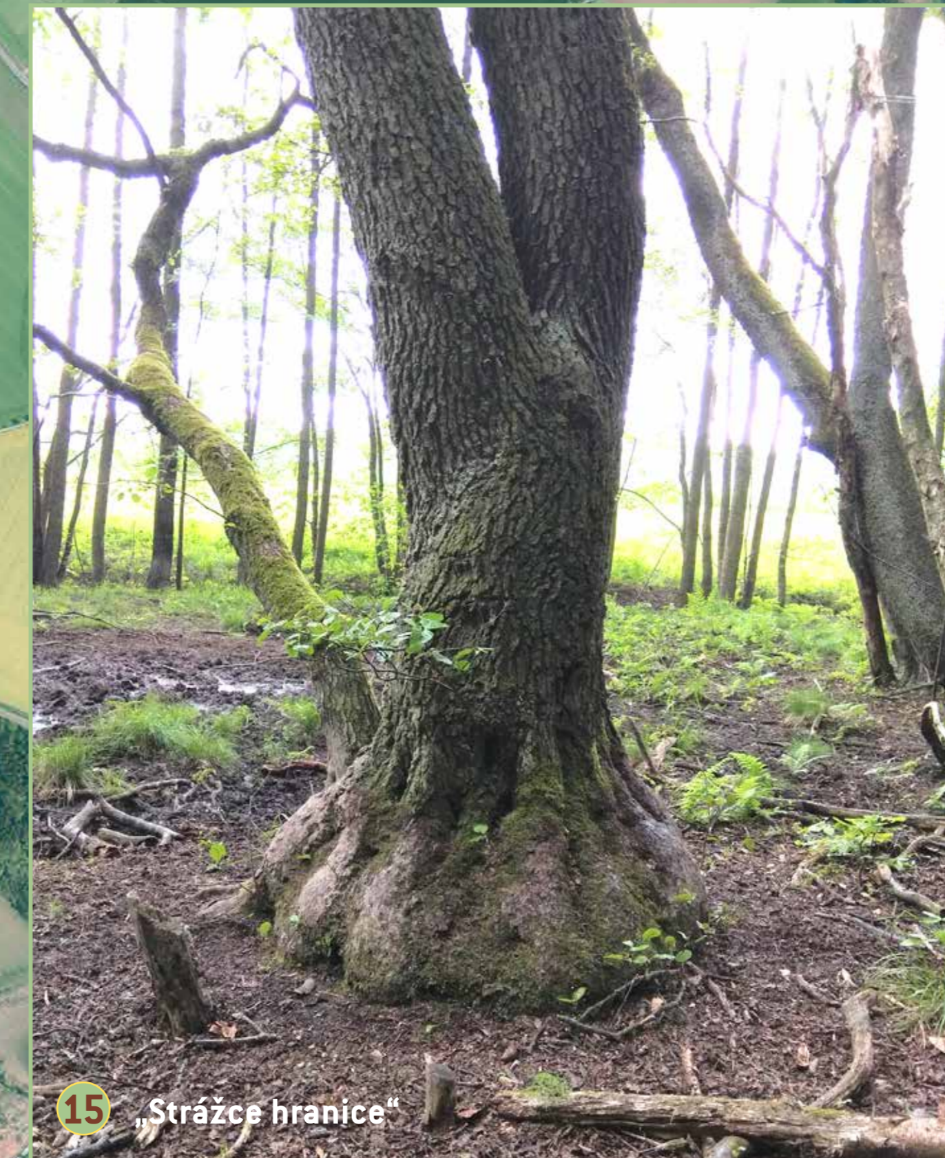
15 „Strážce hranice“