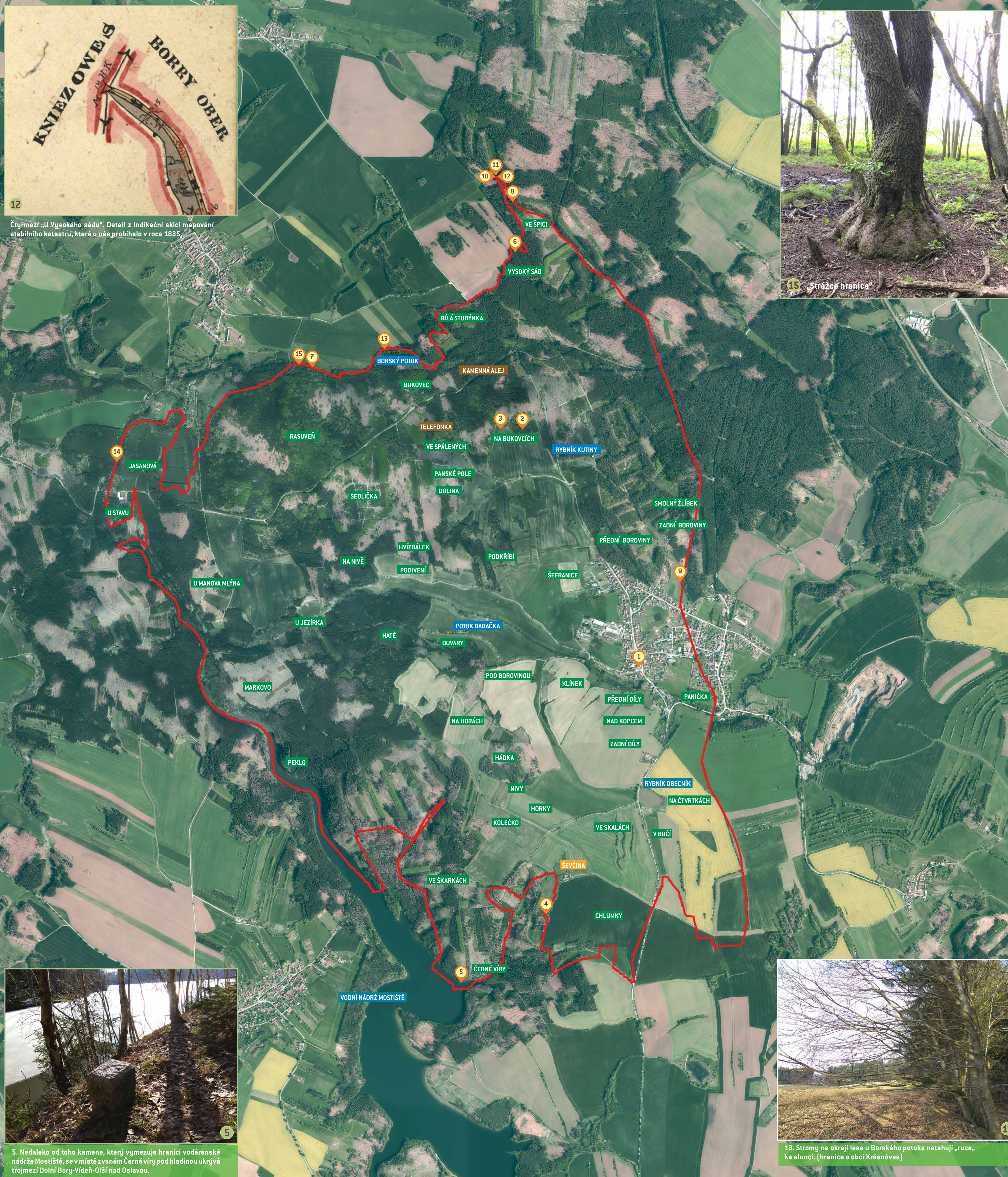
5. Nedaleko od toho kamene, který vymezuje hranici vodárenské nádrže Mostiště, se v místě zvaném Černé víry pod hladinou ukrývá trojmezí Dolní Bory-Vídeň-Olší nad Oslavou.