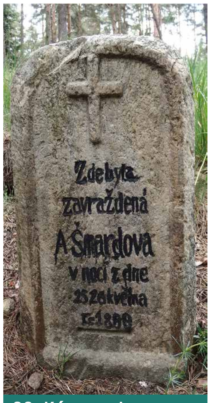
20. Kámen v lese u rybníka Horník

Pomník byl postaven k uctění památky Emila Hladíka *15.10.1902 a Karla Jelínka *1.10.1919, kteří byli popraveni 30.6.1942. Na mramorové desce je nápis: „Svou vlast milovali, pro ni trpěli a padli. Čest jejich památce!“