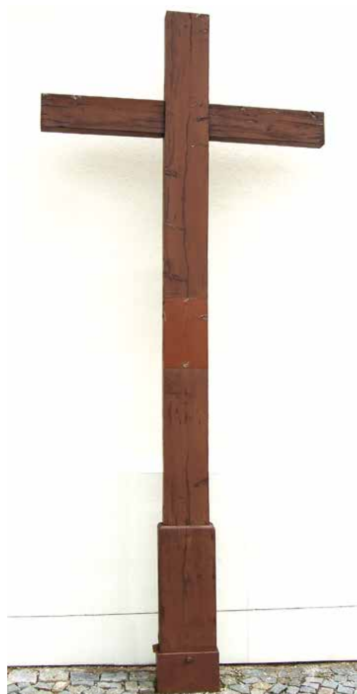
9. Farní kostel sv. Martina

Kříž z leštěného tmavého mramoru stojí u silnice na Krásnéves uprostřed oplocení se schůdky a brankou. Pod štítkem INRI a ukřižovaným Kristem je nápis: „Ježíši Kriste, žehnej naší obci a vlasti. Věnovali občané z Dol. Borů L.P. 1950“. Dříve tu byl konec obce a stával zde kříž dřevěný.