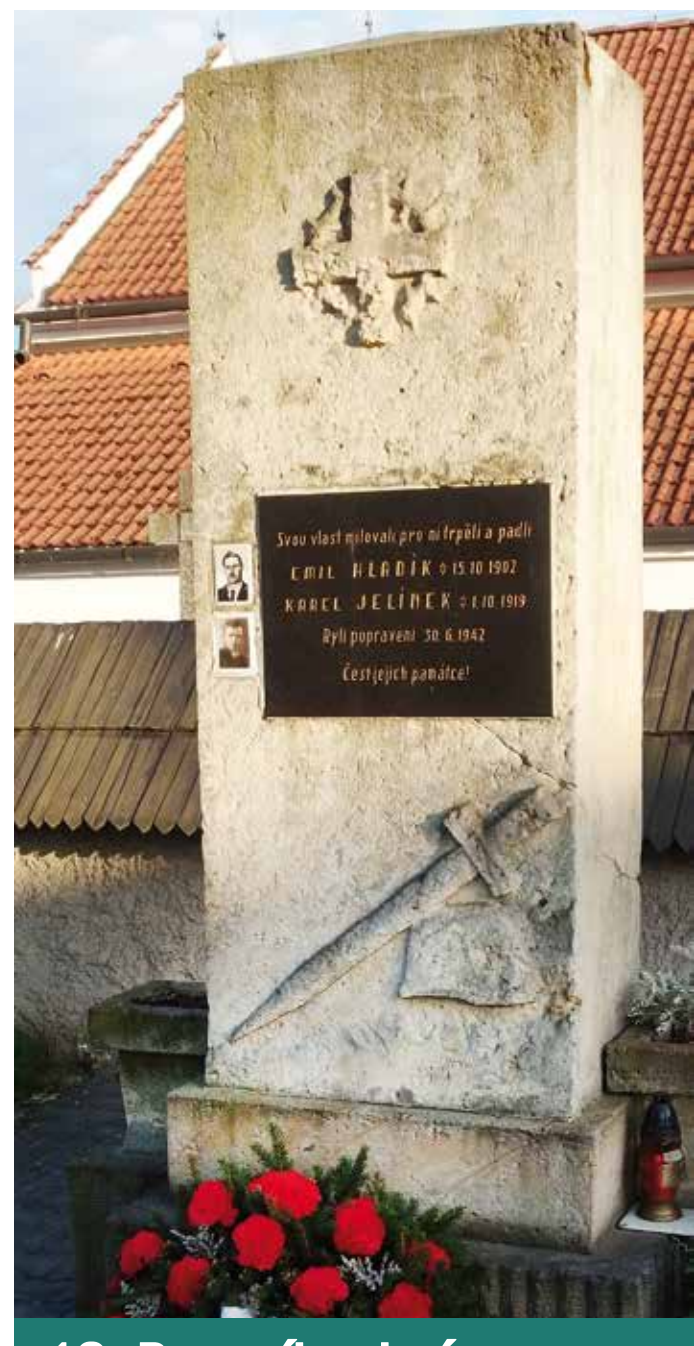
19. Pomník u brány hřbitova u kostela sv. Jiljí