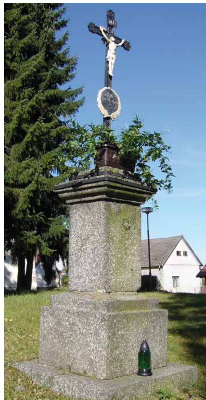
10. U kostela sv. Martina

Dřevěný misijní kříž stojí u vchodu do kostela upomíná na lidové misie konané ve farnosti v letech 1935 a 2008.