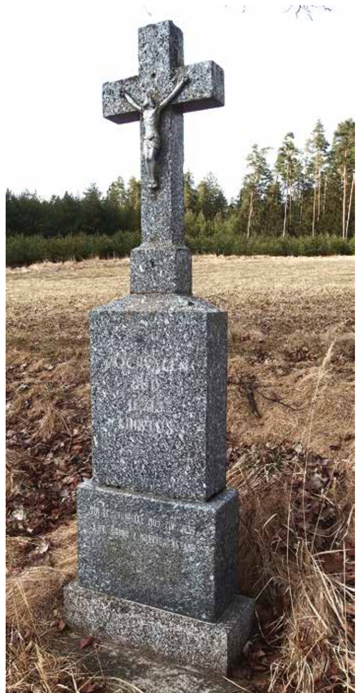
13. U rybníka Bezdrev

Úplně vpravo stojí kovový kříž s ukřižovaným Kristem a andělkem nesoucím tabulku už bez nápisu. V kameném podstavci je vytesán velký kříž, nad ním jsou písmena IHS a pod rameňmi kříže vrocení 1788. Jde o zrekonstruovaný kříž ze zaniklého hrobu ze hřbitova.