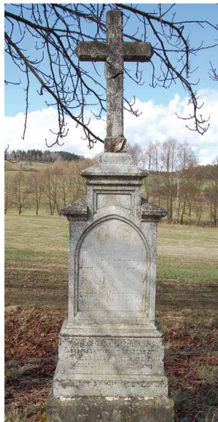
6. K Hatfím