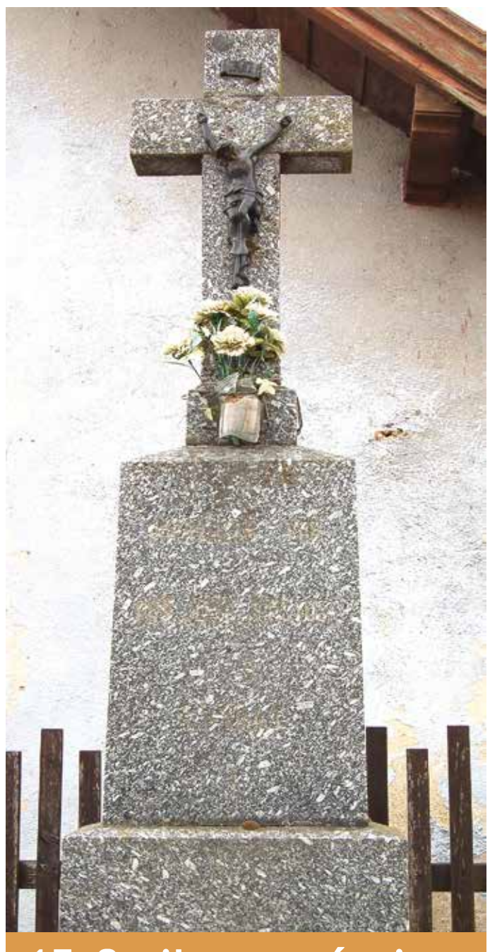
17. Cyrilov na návsi

Kříž z bílého mramoru stojí na betonovém podstavci na okraji osady. Pod štítkem INRI je ukřižovaný Kristus. Pod ním Panna Marie a nápis: „Poutníče, zde málo prodlí, otčenáš se vroucně modlí, by Pán Bůh milostivě nás byl, hříchy naše odpustil. L.P. 1911“.