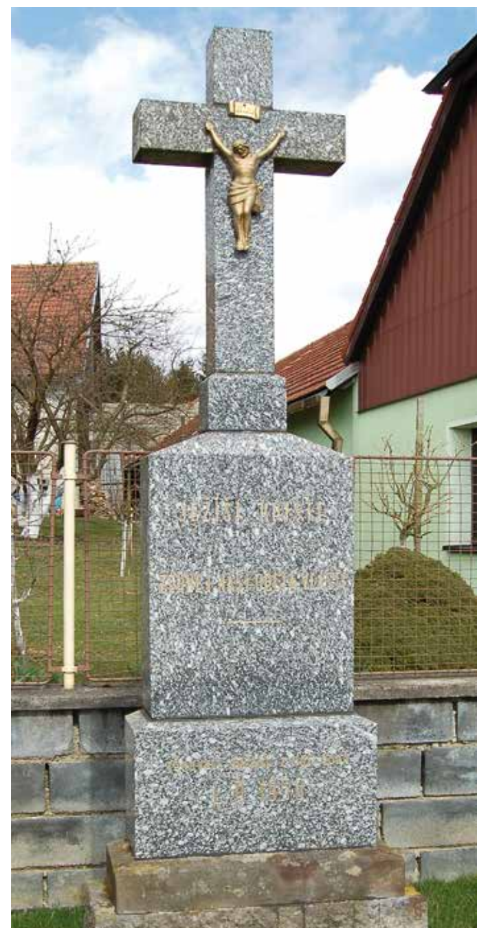
8. V Dolních Borech

Kříž z leštěného tmavého mramoru stojí u brány do hřbitova u kostela sv. Jiljí. Pod štítkem INRI a ukřižovaným Kristem je nápis: „Ježíši žehnej naší obci a celé vlasti. Věnovali občané L.P.1948“.