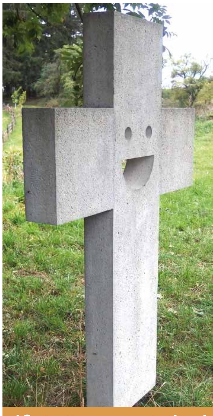
18. Cyrilov u cesty k Jívoví

Kříž z tmavého leštěného mramoru stojí na betonovém podstavci v dřevěném ohrzení. Pod štítkem INRI a ukřižovaným Kristem je nápis: „Pochválen buď Pán Ježíš Kristus! L.P. 1949“.