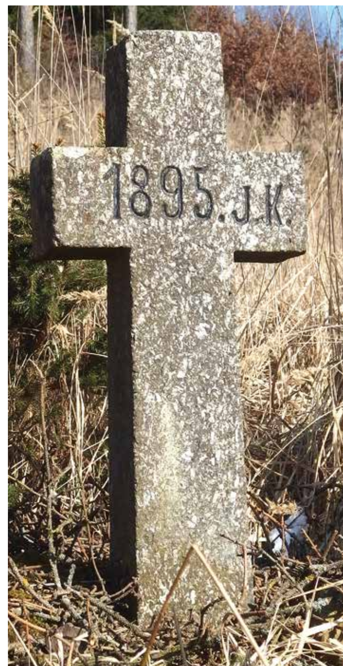
1. Ve Škarkách

V QR kódu je mapa s umístěním křížů. K načtení kódu využijte skener QR kódů nebo fotoaparát v mobilním telefonu. Je nutné mít v tu chvíli aktivované datové připojení k internetu.