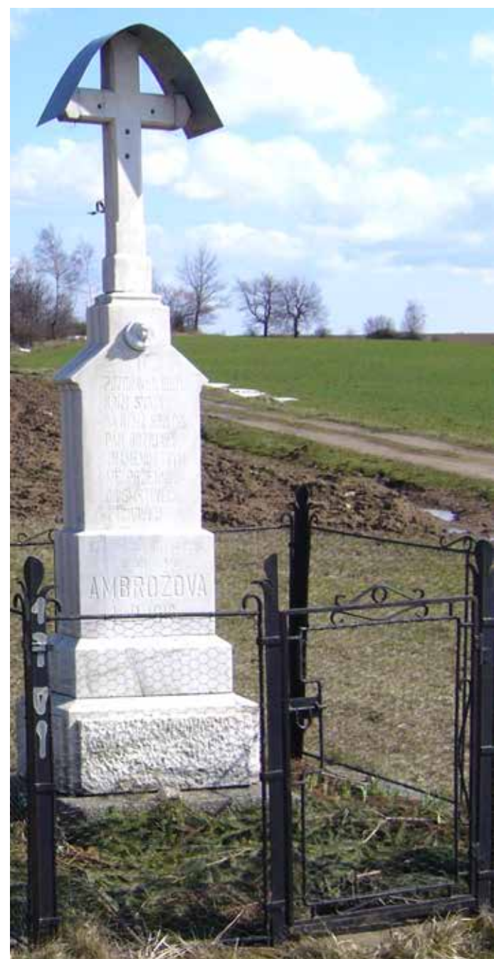
3. U Ševčiny