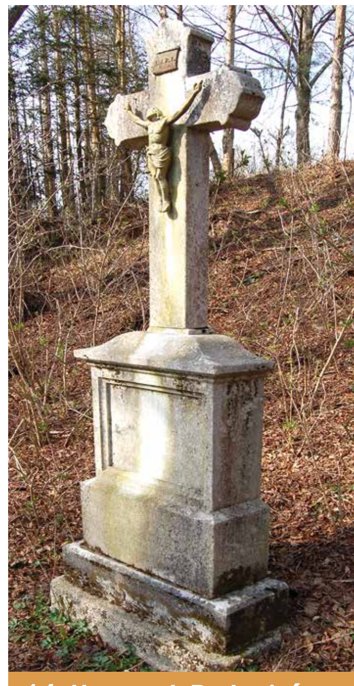
14. U cesty k Radenicím