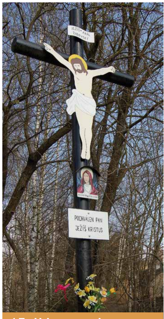
15. U kamenolomu