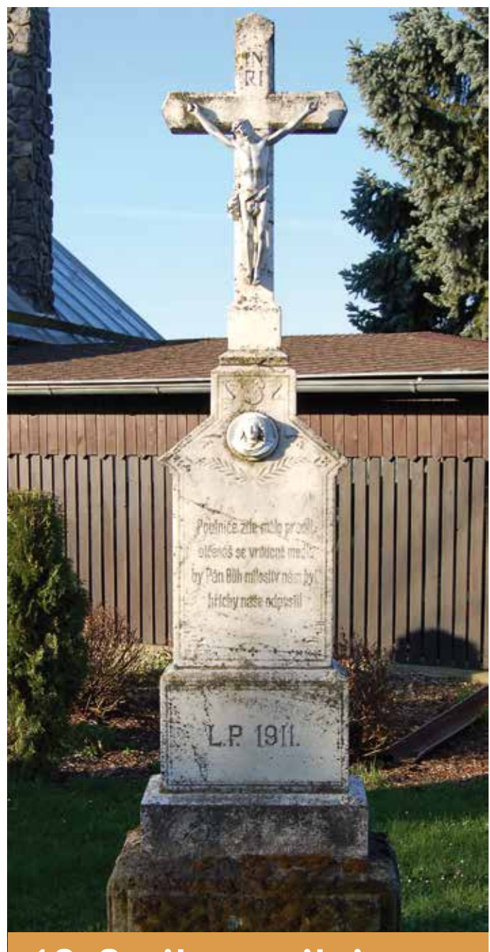
16. Cyrilov u silnice

Původní dřevěný kříž postavený obcí Horní Bory u bývalé cesty k Cyrilovu a posvěcený 9.9.1894 nahradil velký kovový kříž postavený 17.4.1987. Stojí u silnice k Cyrilovu. Pod štítkem s nápisem: „Ježíši králi židovský“, je zobrazen ukřižovaný Kristus. Pod ním je obrázek Panny Marie s nápisem: „Královo míru oroduj za nás“. A nejnižší je nápis: „Pochválen Pán Ježíš Kristus“.