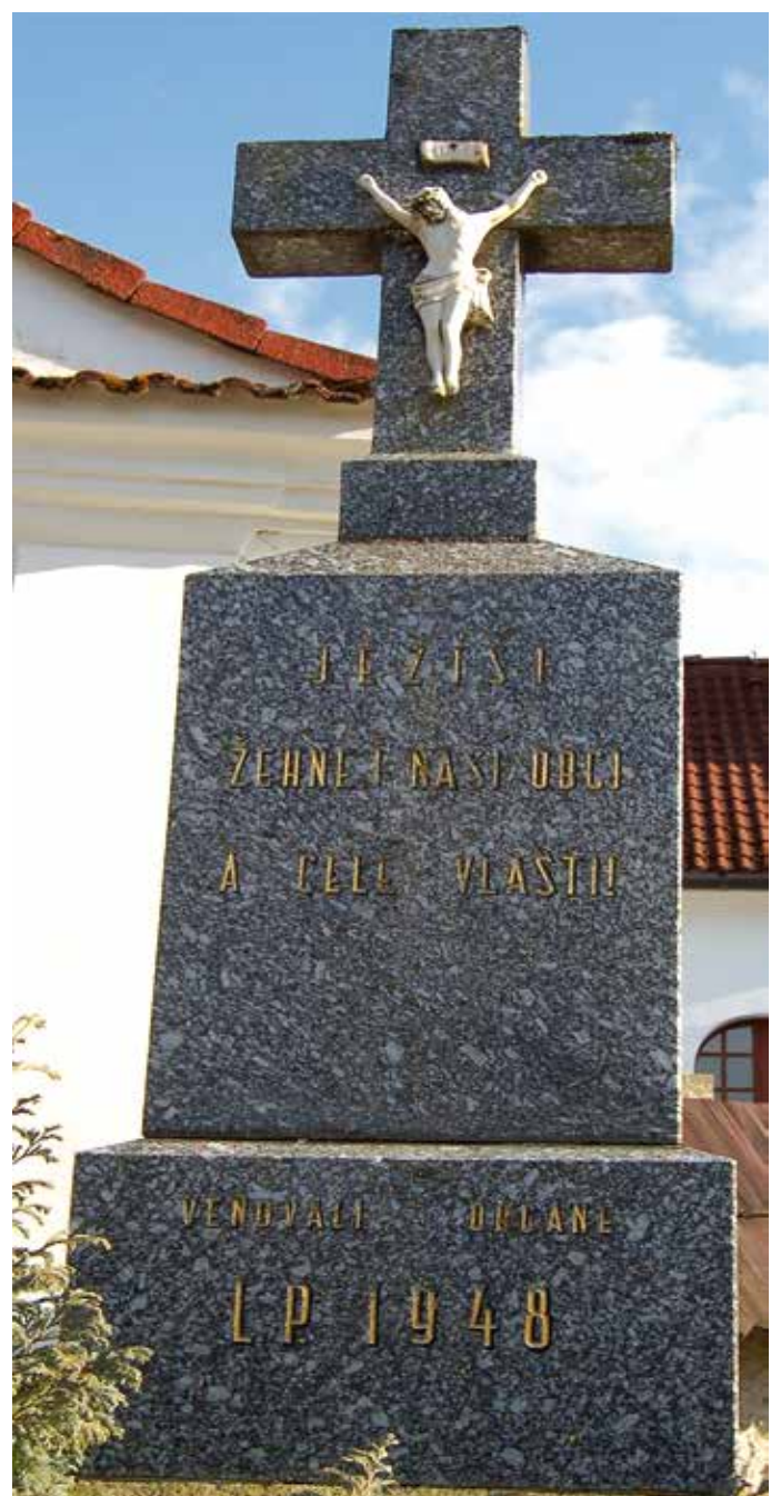
7. U kostela sv. Jiljí