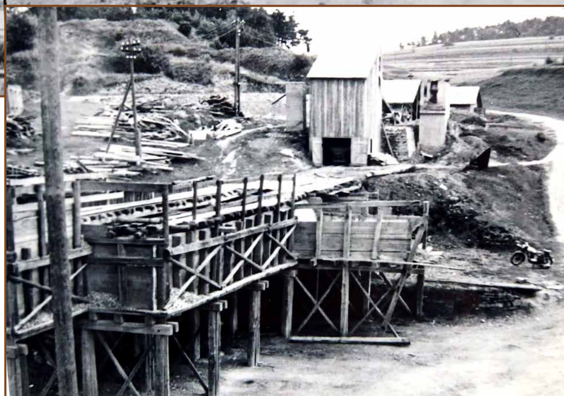
Komory na drcené kamenivo 1953

Nyní má lom 10 vlastních zaměstnanců, kteří zajišťují základní výrobu. Odstřel suroviny je zajišťován dodavatelsky.