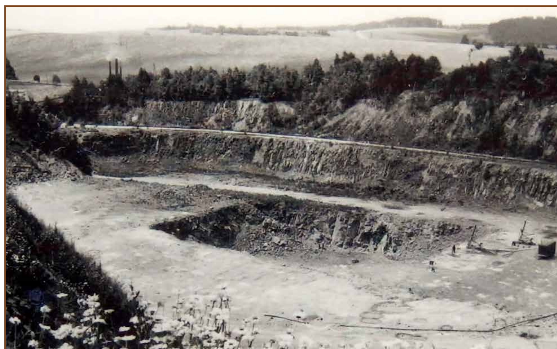
Počátek těžby 3. etáže