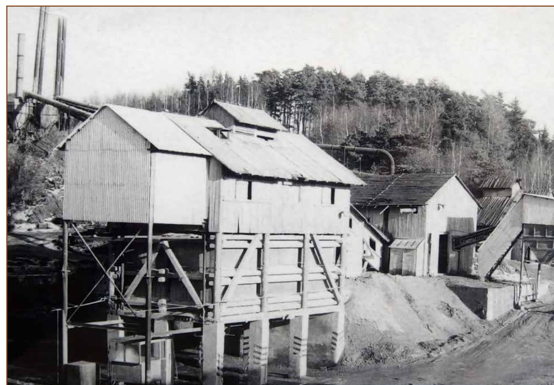
Drtič a komory na drcené kamenivo před r. 1979