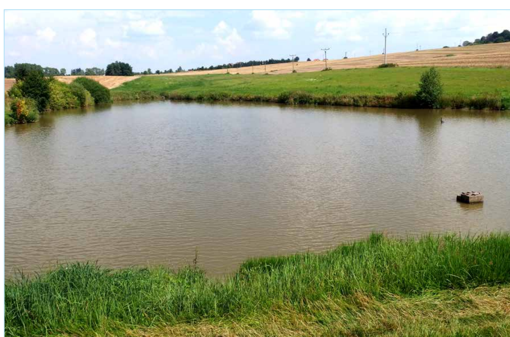
K rybníku Kosteček v polích pod Radenicemi přijde málokdo.

Babačka mívá, ale poskytuje vodu potrubím z Těšíkova rybníka sousednímu rybníku Býčí louka. V k.ú. Dolní Bory pak poskytuje vodu nádrži vybudované v roce 1993 a kousek pod ní ještě malé vodní ploše.