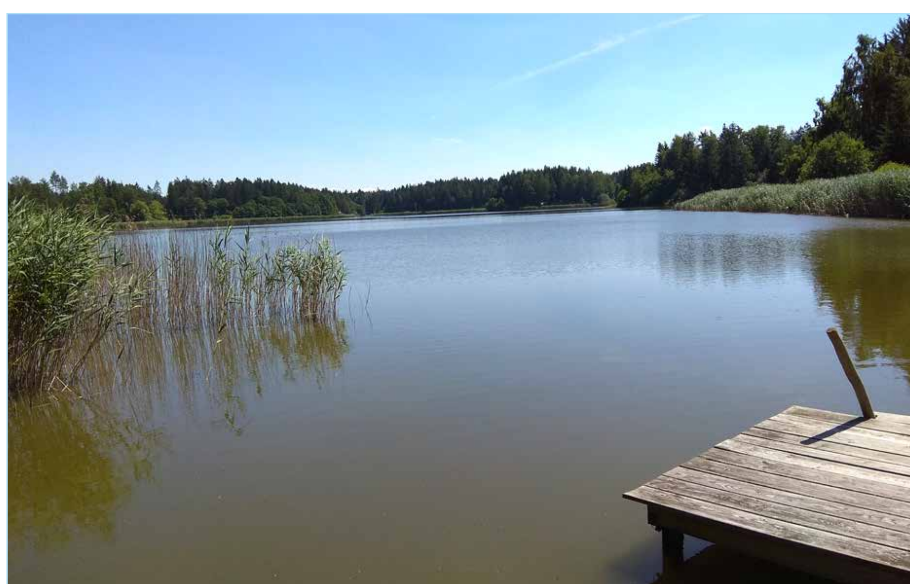
Velký Sklenský rybník.