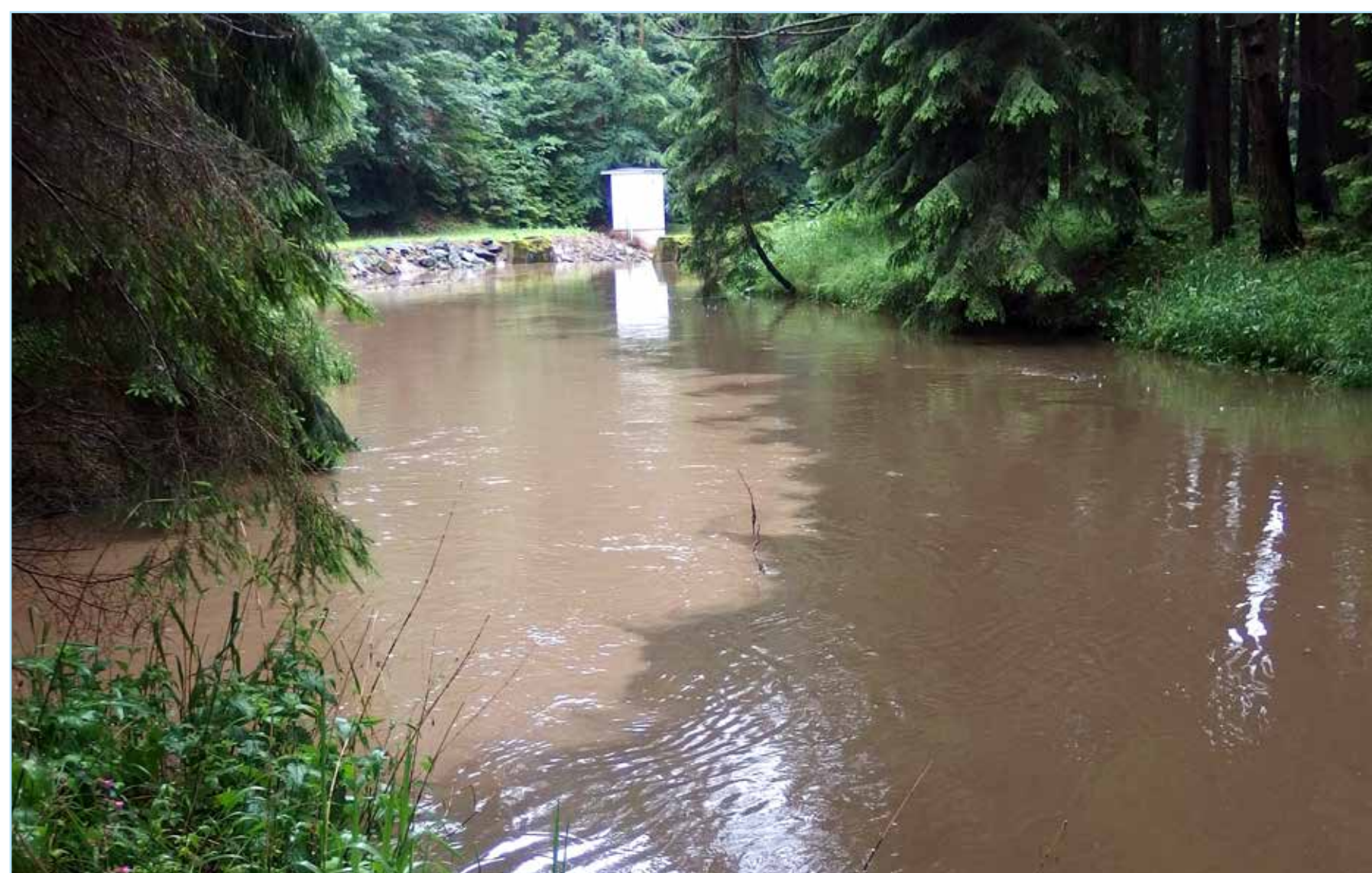
Ústí Babačky do Oslavy - při vydatných deštích je potok zbarven ornicí.