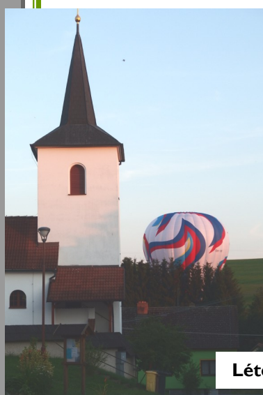
Léto v Borech ....