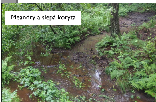
Meandry a slepá koryta

dlouhým příkopem. Na něj navazuje několik dalších příkopů odvodňujících tuto terénní sníženinu. Leží v nadmořské výšce 550 m, což dokládá, že je zde téměř rovina. Teprve soutok odvodňovacích příkopů, které byly vybudovány lesníky proto, aby zde mohl růst smrkový les, vytváří vlastní potok. Protéká západním směrem pod lesní cestou k bývalé Kněževské hájence a pak 150 m až pod silnici Bory-Kněževs. Kolem potoka roste olšový les. Za silnicí potok teče asi 1 km lesem. Nejprve jehličnatým a pak listnatým. V rovinatější části tvoří meandry a další i slepá koryta. Potok posléze zase vytvoří pevné koryto a přiblíží se k okraji lesa. Proteče pod mostem v místech zvaným U obrázku a sleduje asi 200 m okraj lesa. Pak se obrací do polí a teče 300 m rovnou strouhou až k cestě. Zde se připojuje meliorační potrubí s vodou z potůčku, jenž tvoří rybníček Rasuveň, ležící u silnice. Nikoho ani nenapadne, že do tohoto potrubí přitéká další meliorovaný potok. Vzniká u silnice na Kněževs na okraji lesa a polí a už po 300 m mizí pod zemí. Borský potok pod cestou po 100 m mladým jehličnatým lesem přitéká k rybníku Obecníku (1,2986 ha). Ten má pěkně upravenou širokou hráz. Pak potok 250 m