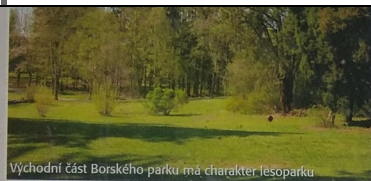
Východní část Borského parku má charakter lesoparku