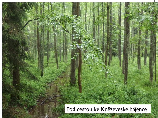
Pod cestou ke Kněževské hájence

teče listnatým porostem a protéká pod místní komunikací. Dále meandruje se stromy zarostlými břehy pod vesnicí a po 300 m podtéká silničku k bývalé pile. Zde se ještě připojuje voda z potůčku