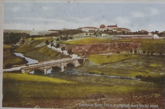
Třestnice Bory 1913, v popředí starý říčtýcký most

Pod hrázi přehrady je přes údolí řeky veden