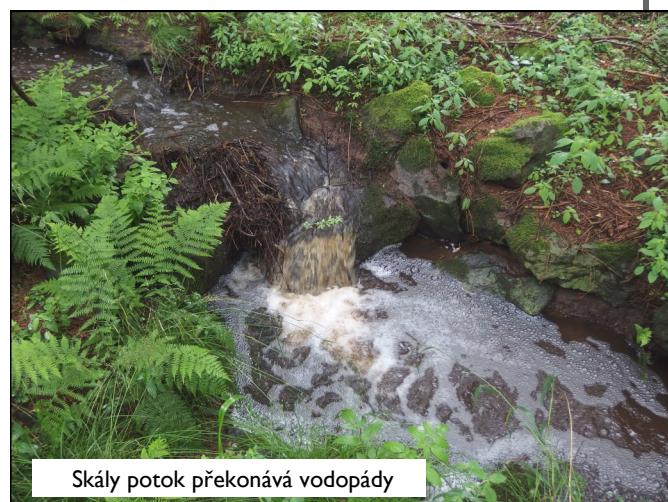
Skály potok překonává vodopády