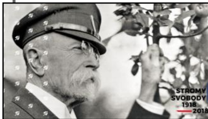
STROMY SVOBODY 1918 2018