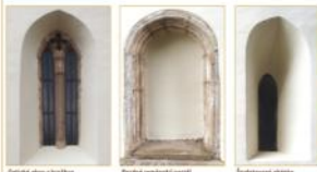
Gotické okno v hrobově