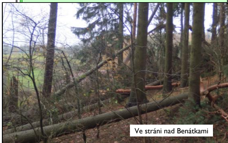
Ve stráni nad Benátkami