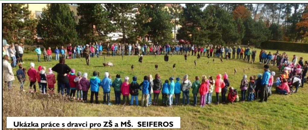
Ukázka práce s dravci pro ZŠ a MŠ. SEIFEROS