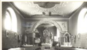
Interiér kostela z přelomu 19-20. století.