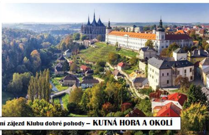
Jarní zájezd Klubu dobré pohody – KUTNÁ HORA A OKOLÍ

Navštívíme Geologickou expozici, prohlédneme si historickou část města, navštívíme Muzeum stříbra, v Dačického domě bude pro nás připraven program. Během polední pauzy je možné navštívit chrám sv. Barbory, nebo Muzeum lega a zrcadlové bludiště. Odpoledne navštívíme rozhlednu Havířská bouda (je vybavena výtahem!) a pozoruhodný kostel v obci Grunta.