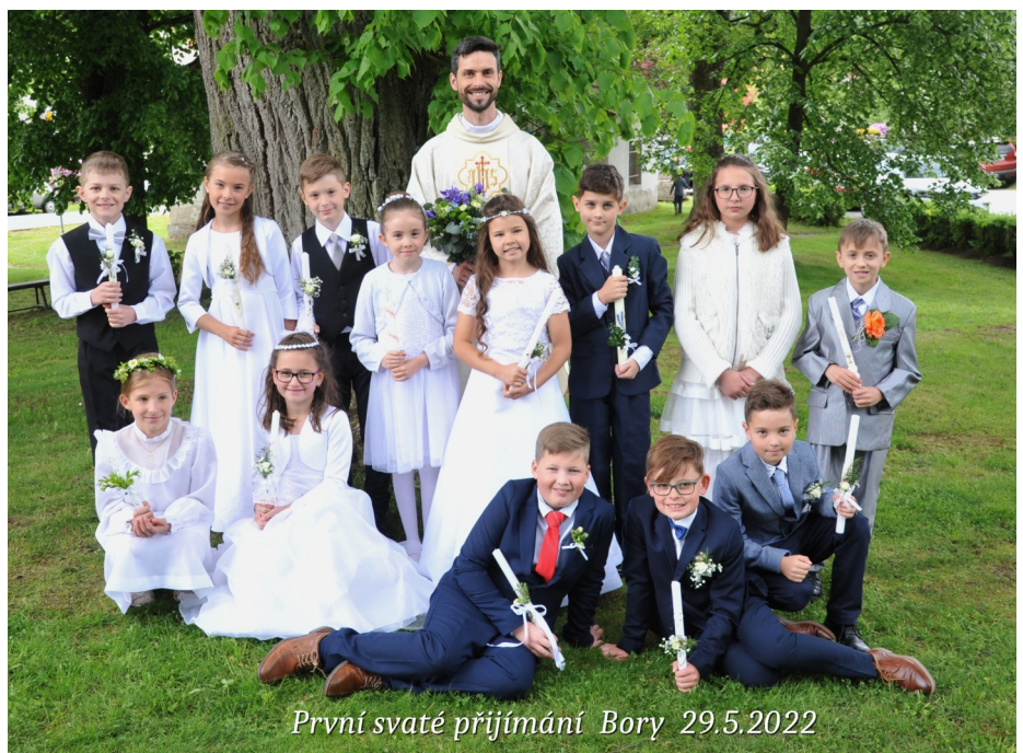
První svaté přijímání Bory 29.5.2022