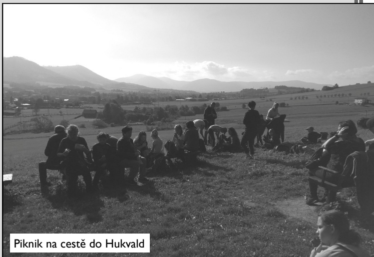
Piknik na cestě do Hukvald