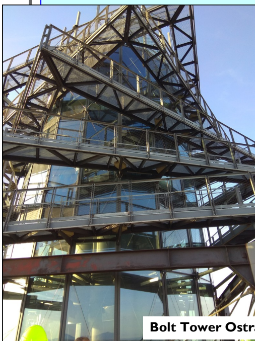
Bolt Tower Ostrava - str.10