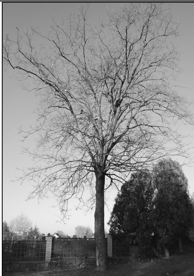
Jeden javor roste napravo od brány