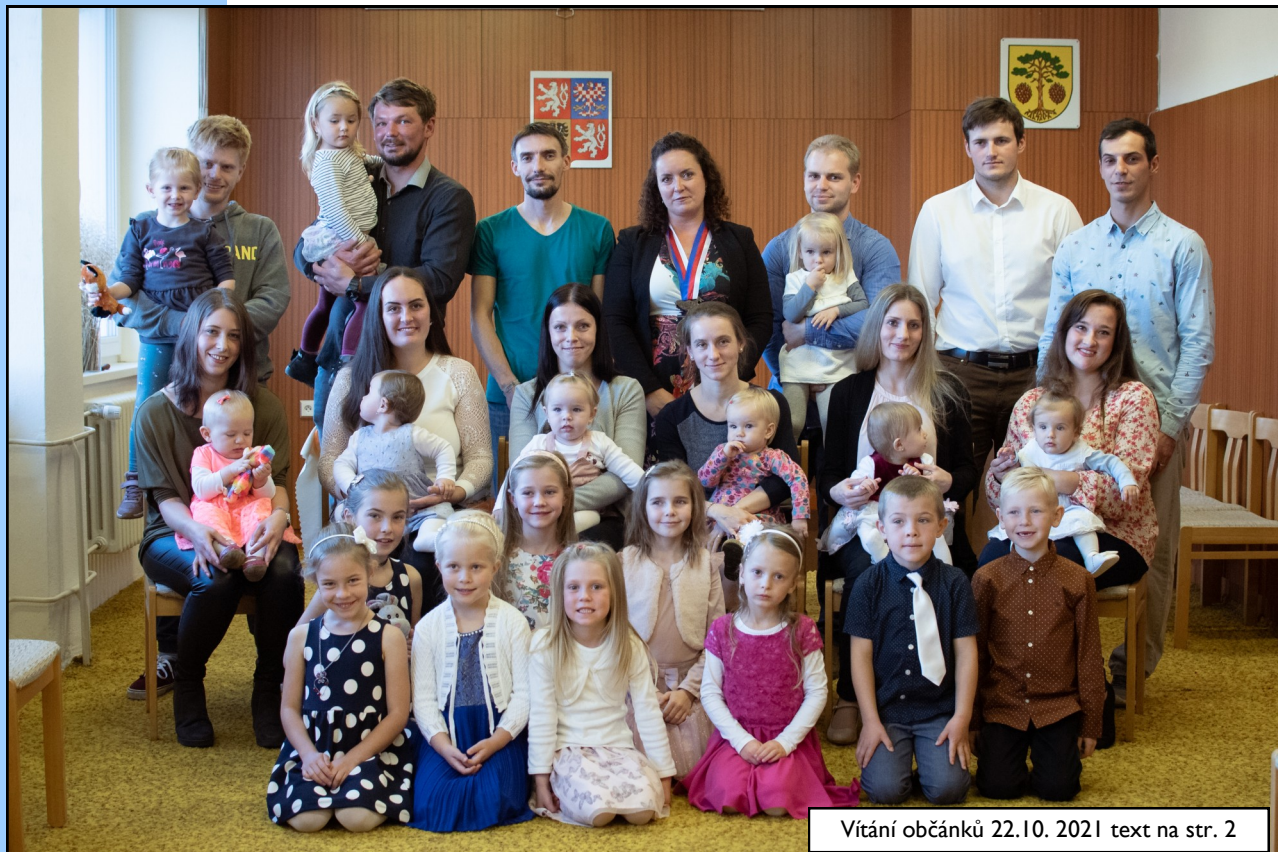
Vítání občánků 22.10. 2021 text na str. 2