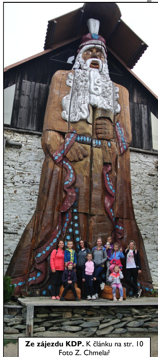
Ze zájezdu KDP. K článku na str. 10