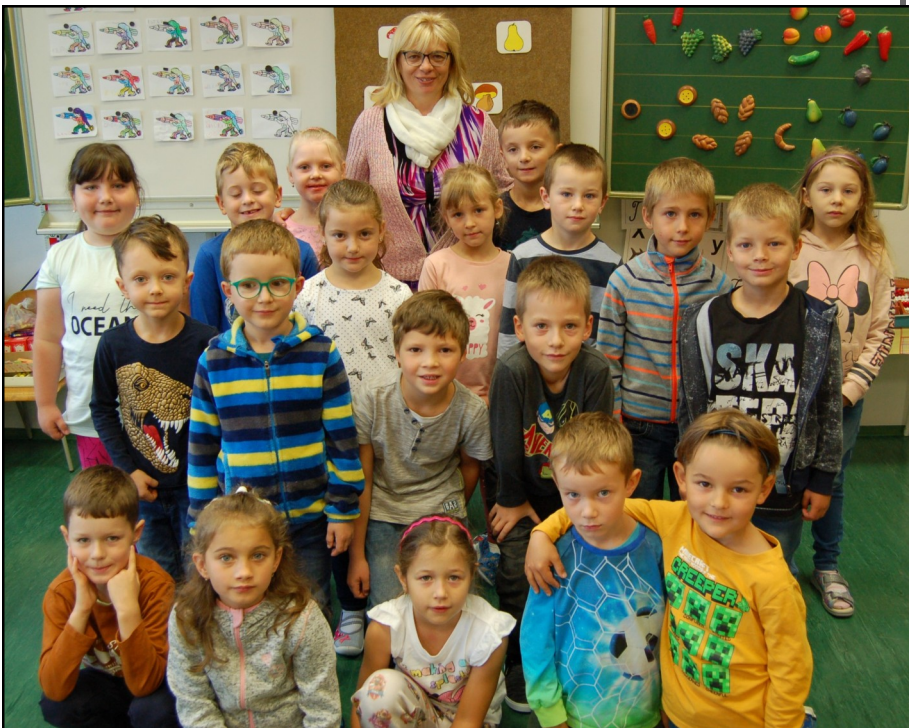
Slavnostní zahájení 1.9. a první, již „pracovní“ den 2.9.. Hodně štěstí a radosti vám přejeme!