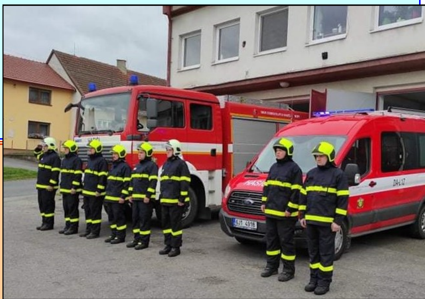
Uctění památky tragicky zesnulých hasičů - str.5