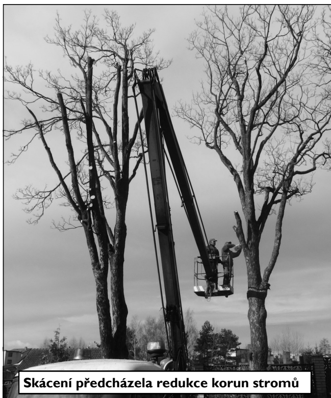
Skácení předcházela redukce korun stromů