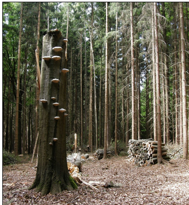
Odborníci a plány péče doporučují alespoň částečně ponechávat padlé stromy na místě. Tlející dřevo je důležité zejména pro houby, hmyz, ptáky a k zúrodnění půdy.