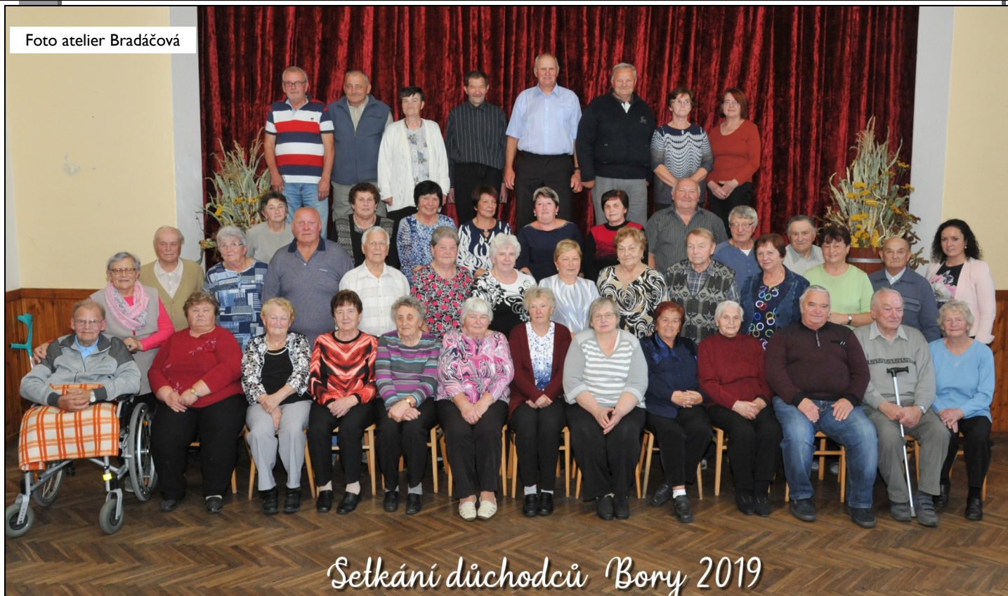
Setkání důchodců Bory 2019