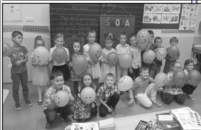
První školní den letošních prvňáčků.