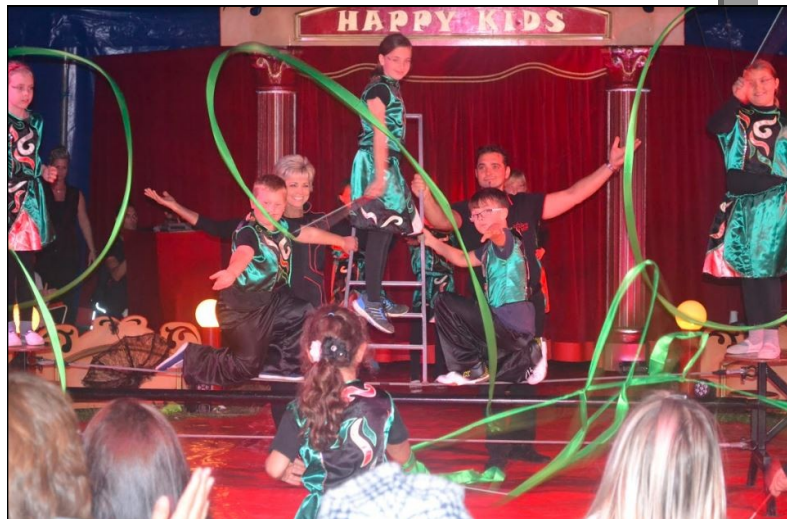
Úžasná vystoupení žáků naší školy. Text na str. 12