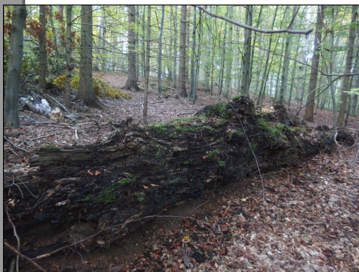
Do nedávna to byl jen tento, dlouhá léta nakloněný obrovský a dutý buk, který zůstal po zřícení ležet v porostu.

V Rasuvni se hospodaří dle lesního hospodářského plánu, ve kterém jsou zapracovány požadavky ochrany přírody. Po více než 40. letech státních lesů, zde zase hospodaří původní