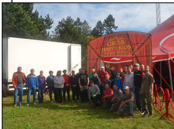
↑ Společné stavění cirkusového stanu