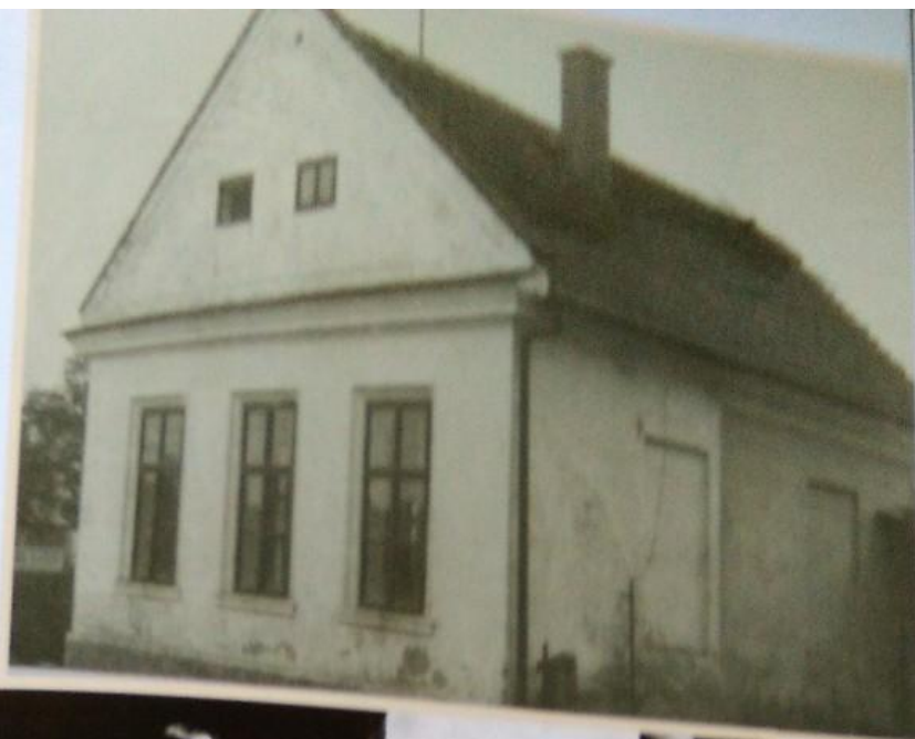
Děti mateřské školy vulubnu 1967