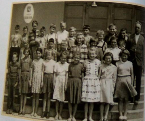
II. třída (3.-5. ročník) v roce 1960/1961