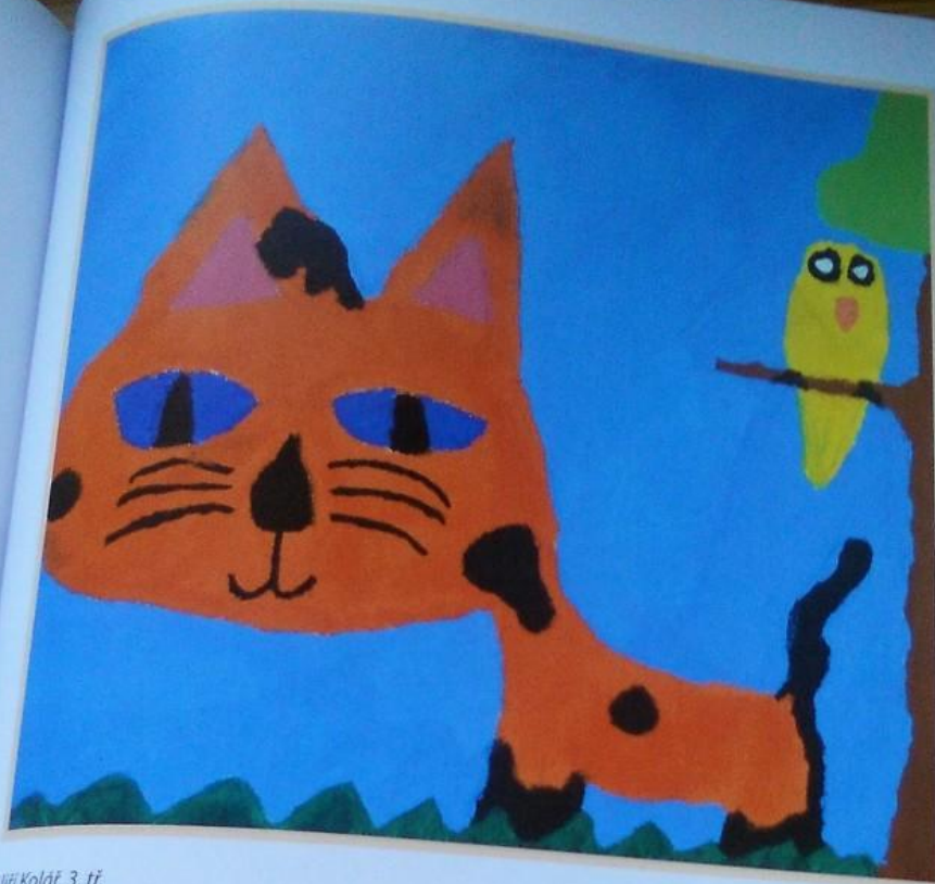
Jiří Kolář, 3. tř.