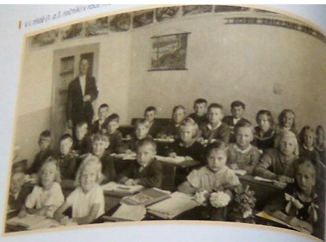
VI. třída (1. a 3. ročník) v roce 1948