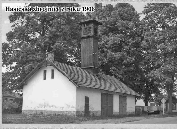
Hasičská zbrojnice z roku 1906