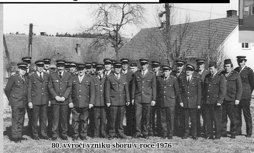
80. výročí vzniku sboru v roce 1976