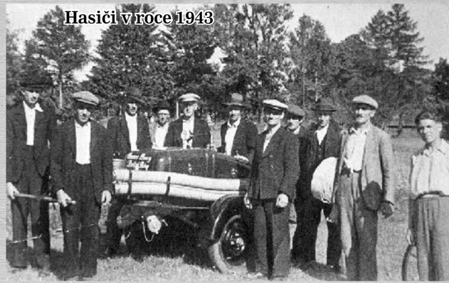
Hasiči v roce 1943