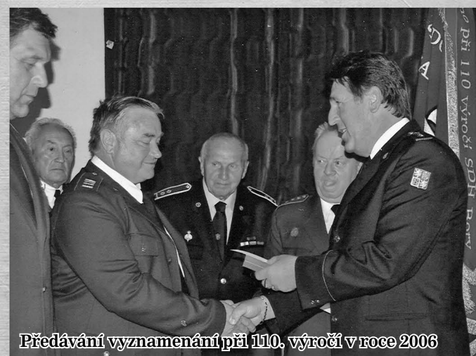
Předávání vyznamenání při 110. výročí v roce 2006