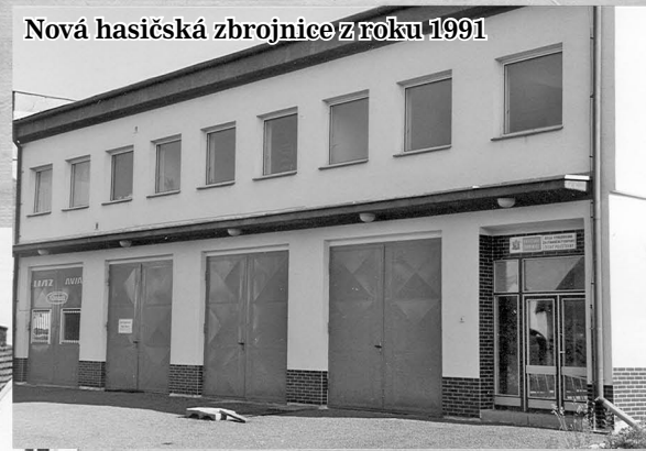
Nová hasičská zbrojnice z roku 1991