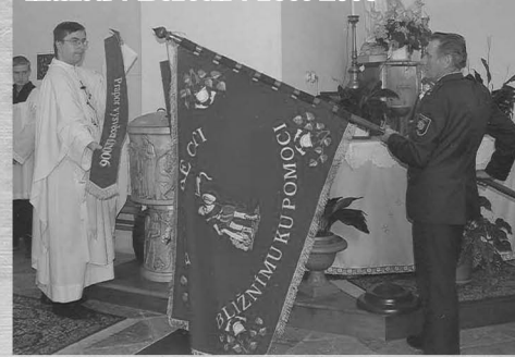
Žehnutí historického praporu při 110. výročí vzniku Sboru dobrovolných hasičů v Borech v roce 2006