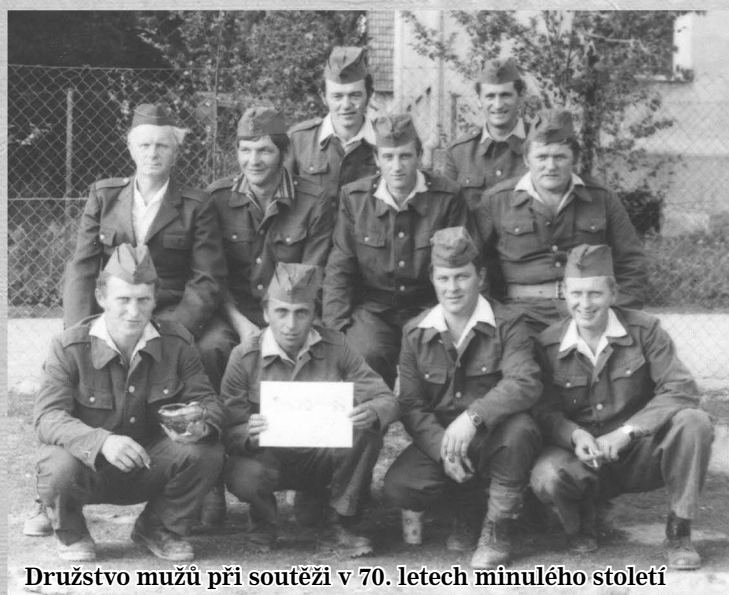
Družstvo mužů při soutěži v 70. letech minulého století