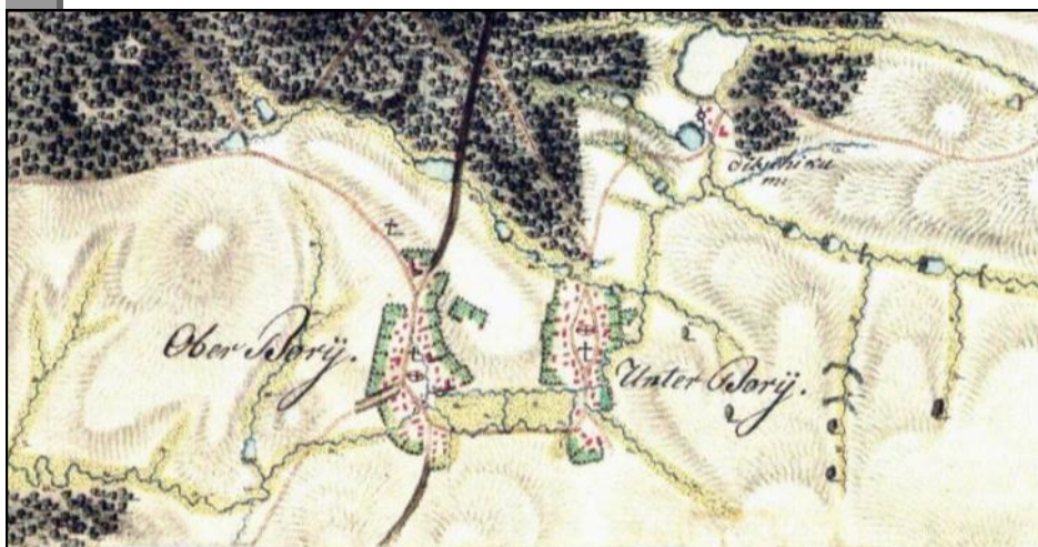
Mapa vojenského mapování Moravy z let 1764 až 1768 – detail Dolních a Horních Borů

Naproti tomu průběh cesty, procházející Bohdalovem, Radostínem a Křižanovem a protínající území dnešních Borů, je dostatečně dokumentován nejen přítomností ve starším období