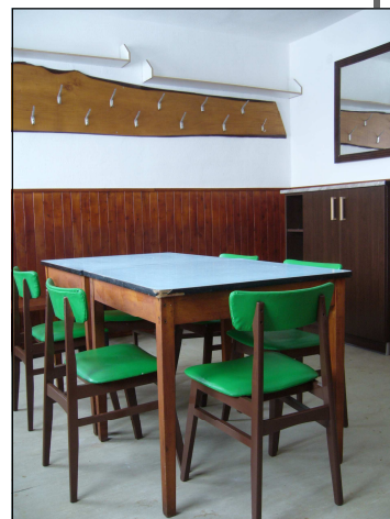
Kabiny - chodba září čistotou

S pomocí programu Obnovy vesnice Vysočiny se uskutečnila dlouho plánovaná rekonstrukce sociálního zařízení na sportovních kabinách . Jsou vybudovány nové záchody, technická místnost, provedena výměna oken a vstupních dveří. Odborné práce provedla firma Skryja ze Žďáru nad Sáz. Velký kus práce, zejména při bourání a výměně oken zde provedli sportovci. A další významný kus práce odvedly naše pracovnice VPP. Vymalování všech prostor, natírání dřevěných obkladů, nábytku, dveří a úklid. Celkové náklady činily 358 074,- Kč, z toho dotace činila 140 000,- Kč