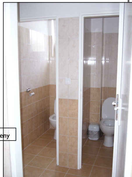
Kabiny - WC ženy

Výstavba nové MŠ. V letošním roce je zcela poprvé možné žádat o grant na výstavbu Mateřských školek. Máme stavební projekt a všechna povolení. Projekt do Regionálního operačního programu Jihovýchod se žádostí o grant je před dokončením. Náklady na novou MŠ budou asi 16 mil. Kč, pokud se nám podaří dotaci získat, tak ta bude 85 %.