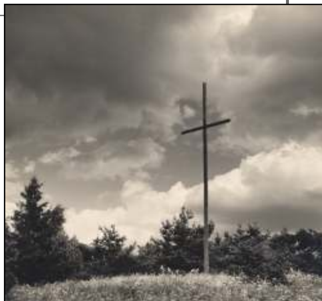
Kříž u Radenic