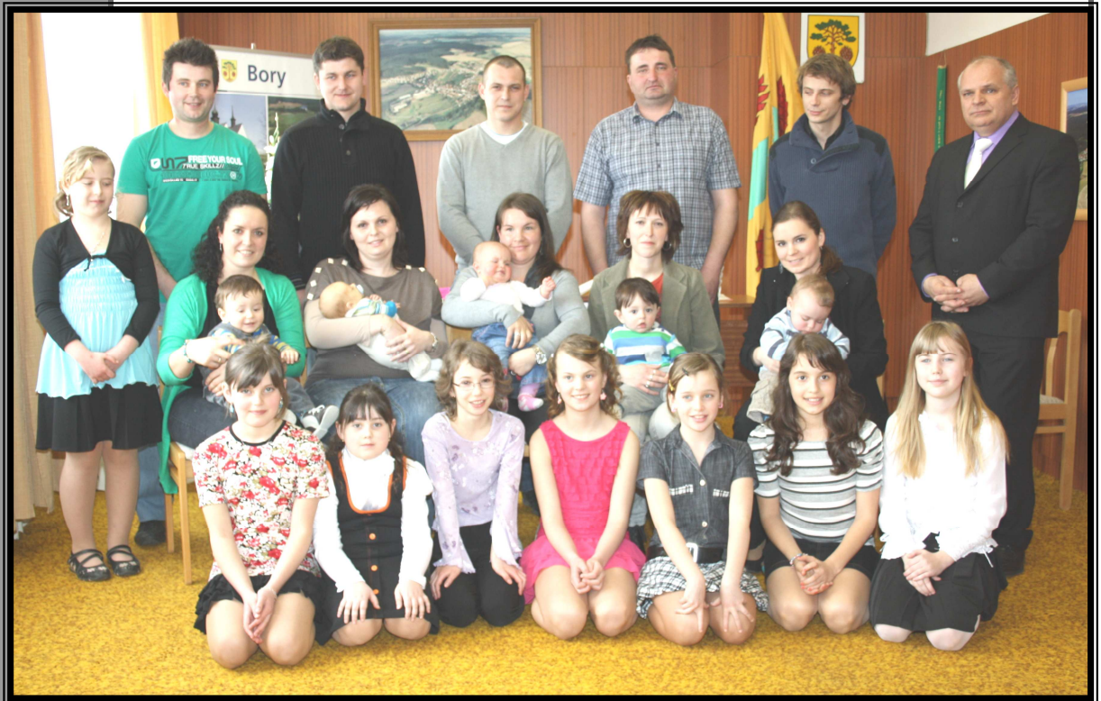
14.4.2013 bylo slavnostně přivítáno 5 našich nových občánků. Pět prvorozených dětí!