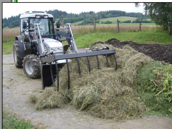
Správce kompostárny Bohuslav Hašek v plné práci